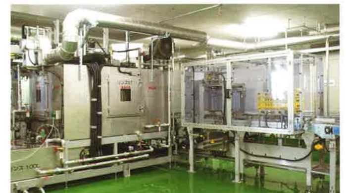
コンテナ自動洗浄装置・コンテナ自動折りたたみ装置 コンテナを洗浄し、自動で折りたたみます。