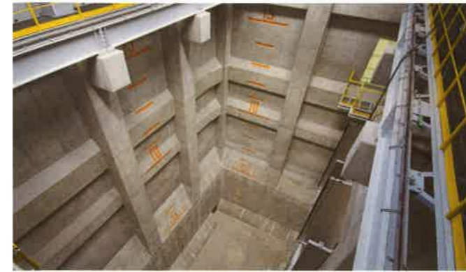
ペットボトルピット ためられたペットボトルをペットボトルクレーンでペットボトル受入ホツバへ投入します。