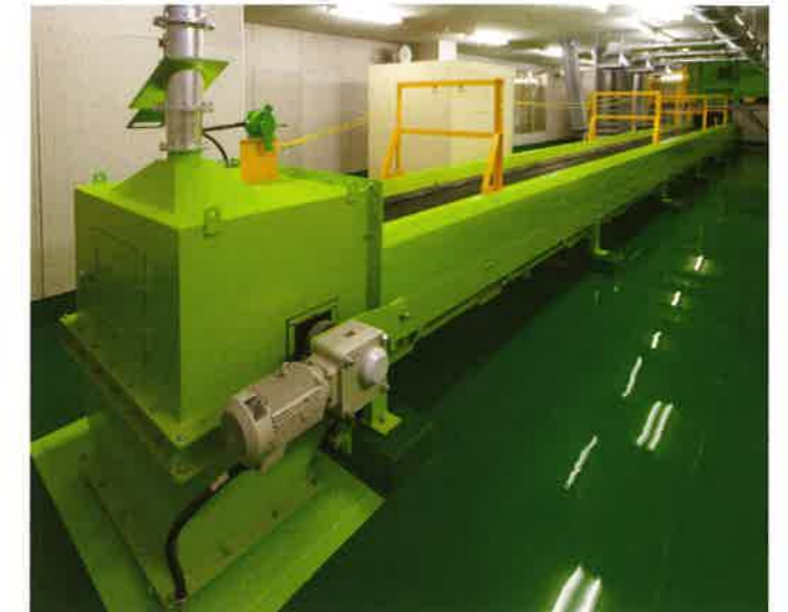
不燃ごみ不適合除去装置 手作業により不適合物を取り除きます。