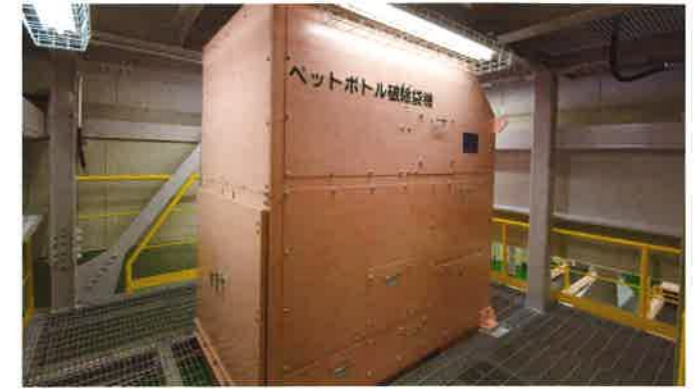
ペットボトル破砕袋機 袋を取り除き、不適物除去装置へ送ります。