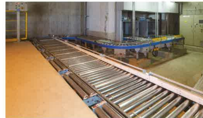
空きびん受入コンベヤ 空きびんをコンテナごと空きびんエレベータへ送ります。