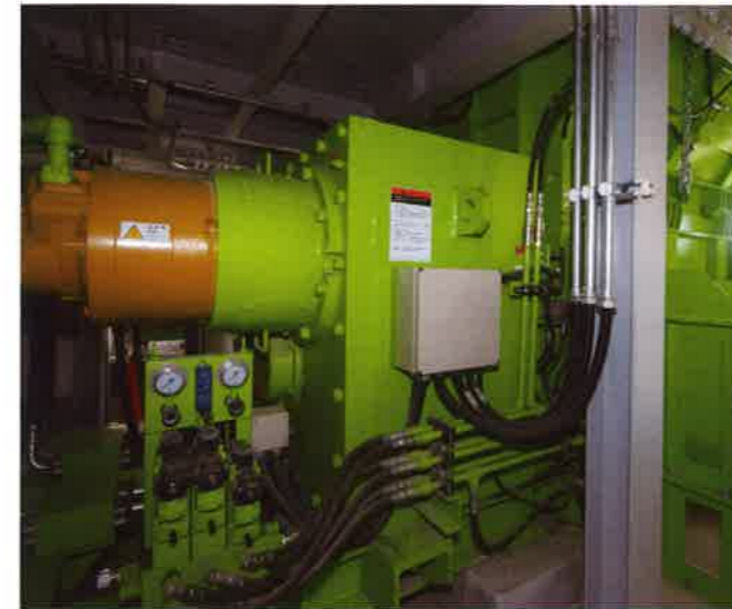
不燃性粗大ごみ粗破砕機 ゆっくりと回転する二つの刃でごみを大まかに破砕し、その後の処理をスムーズにします。