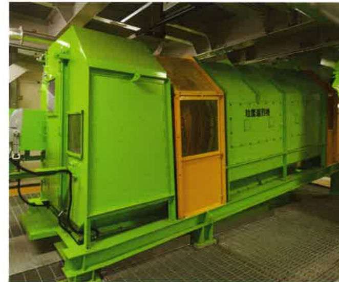
粒度選別機 破砕ごみを回転する円筒のふるいにかけて、粒度差によって不燃物と可燃物・アルミ類に分別します。