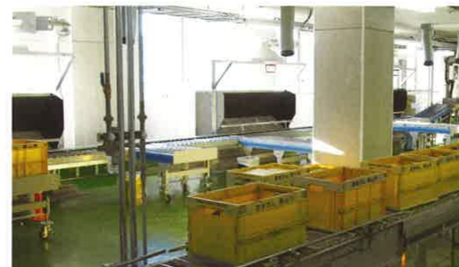
空きびん選別装置 手作業によりびんを色ごとに選別します。