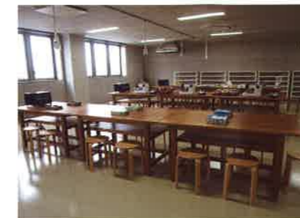
修理・再生室(体験工房)