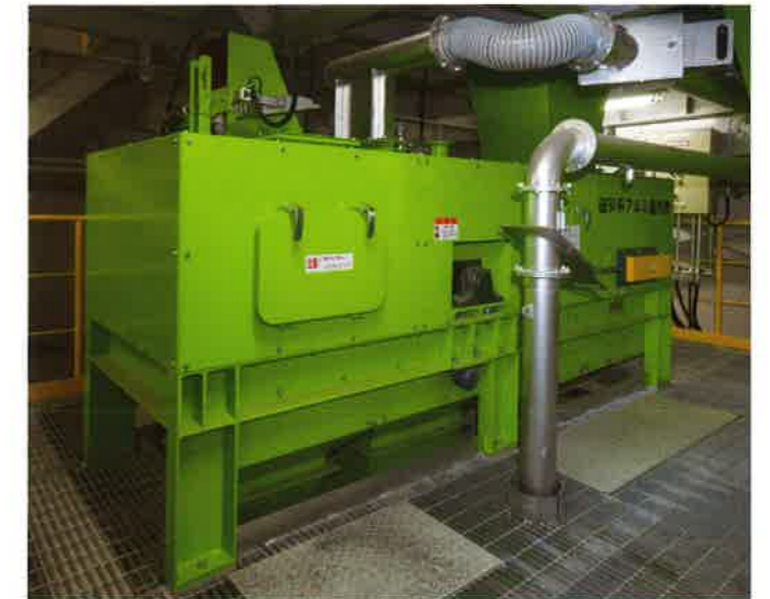
破砕系アルミ選別機 回収した可燃物・アルミ類からアルミを選別します。