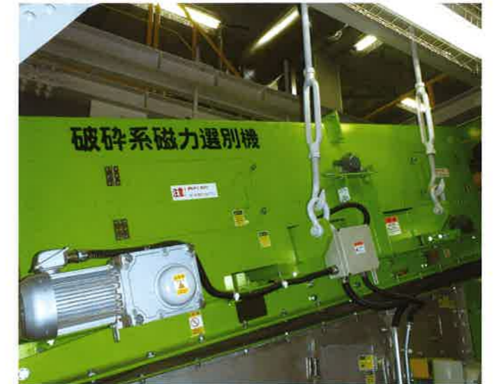
破砕系磁力選別機 電磁石を使って破砕物の中から鉄類を選別します。