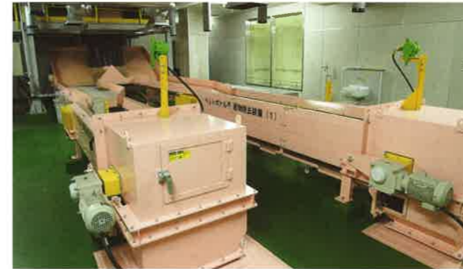
不適物除去装置 手作業により不適物を取り除きます。