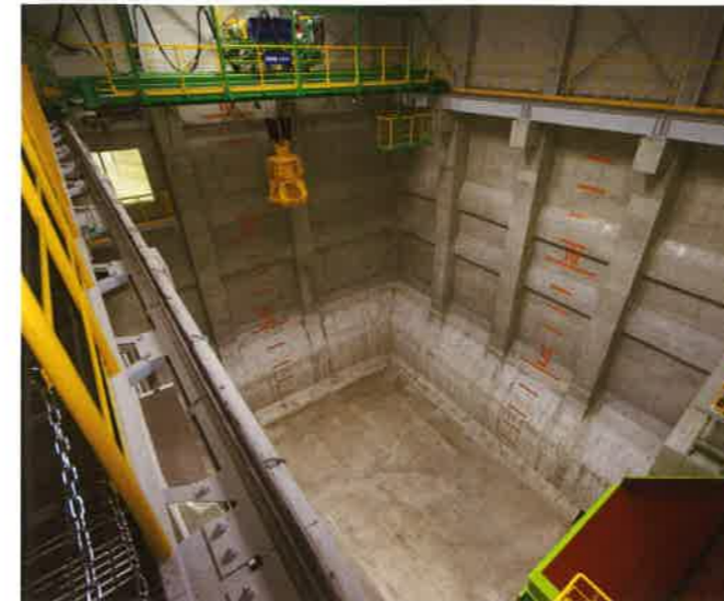
不燃ごみピット・不燃ごみクレーン ためられた不燃ごみを不燃ごみクレーンで攪拌し、不燃ごみ受入ホッパへ投入します。