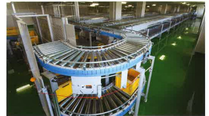
空きびんストックコンベヤ 空きびんを空きびん選別装置へ送ります。