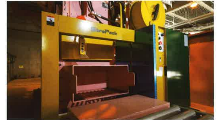
ペットボトル圧縮梱包装置 回収されたペットボトルを圧縮し梱包します。