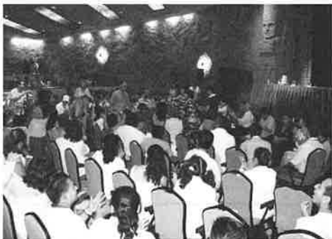
アカプルコ会議の様子(イメージ)