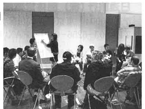
ベルリン会議の様子(イメージ)