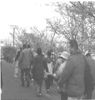
ボ ラ ン テ イ ア かつ 活 どう 動