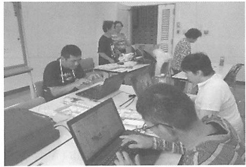
こうりゅうかつどう ちいき まつ 交流活動～地域の祭りで