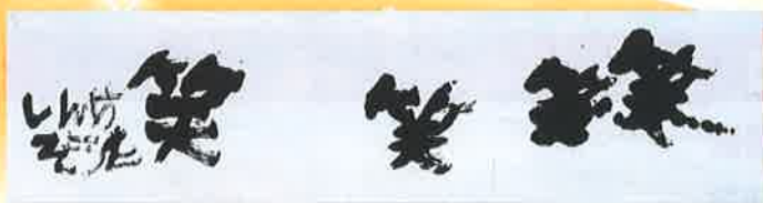
笑笑 新家 壮太(福井県)