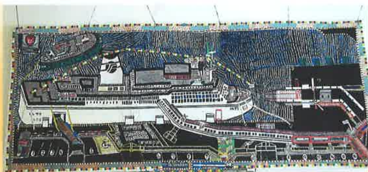
太平洋フェリーいしかり 杉上 彰治(宮城県)